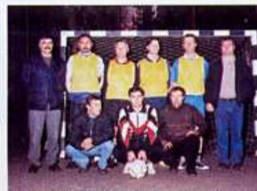
III Трећи: Штанцерај