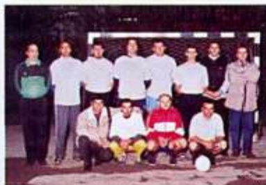
I Победничка екипа: Одржавање 9103