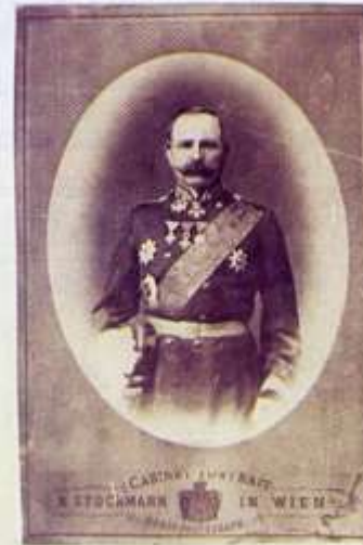
Миливоје Петровића Блазнавац

Писмо Миливоја Петровића Блазнавца из Крађујевца упућено Илији Гарашанину 9. јануара 1864. године