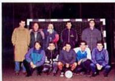
II Други: ПЈ 13